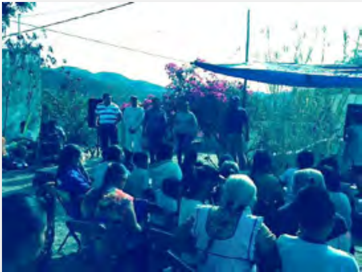
En San Vicente Boquerón, Acatlán