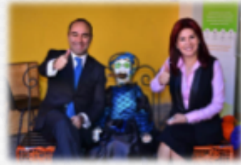
Ofrendas en el Congreso del Estado con motivo del Día de Muertos 29 de Octubre