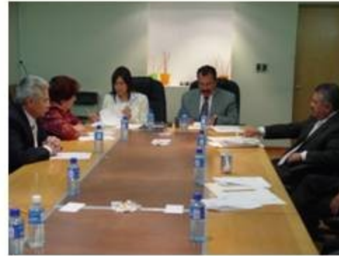
Archivo y Biblioteca 1 reunión