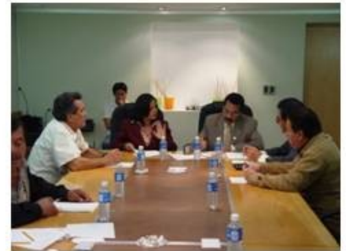
Asuntos Indígenas 2 reuniones