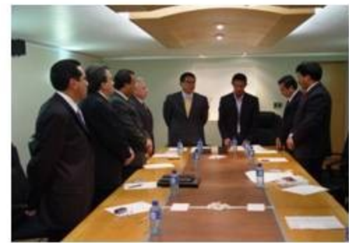
Asuntos Municipales 2 reuniones