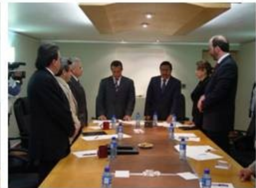
Hacienda Pública y Patrimonio Estatad y Municipal 5 reuniones