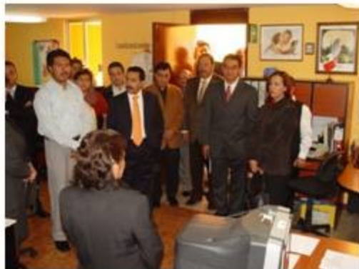
Inspectora del Órgano de Fiscalización Superior 3 reuniones