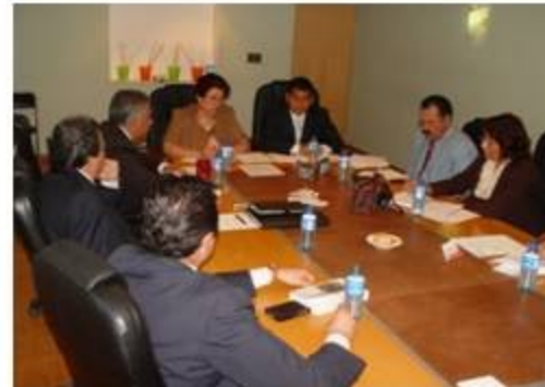
Migración y Asuntos Internacionales 1 reunión