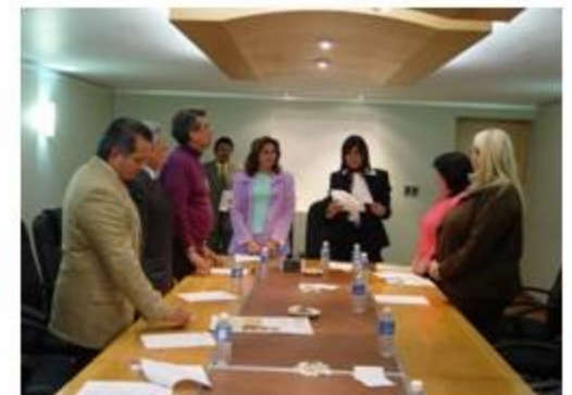
Desarrollo Económico y Turismo 3 reuniones