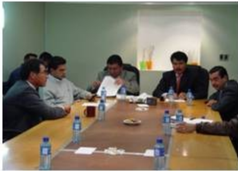
Desarrollo Urbano y Medio Ambiente 3 reuniones