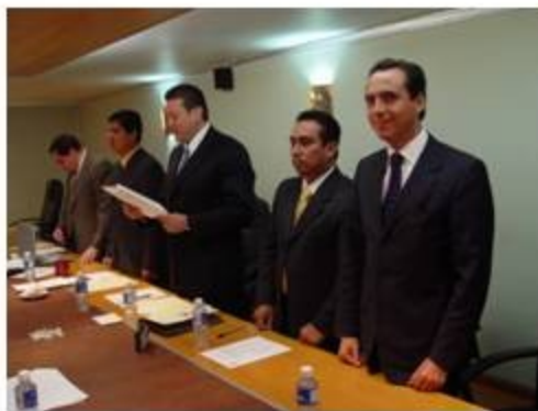
Gran Comisión 7 reuniones

En sentido se efectuaron 67 reuniones, distribuidas de la siguiente manera: 7 de Gran Comisión; 47 de Comisiones Generales; y 13 de Comités.