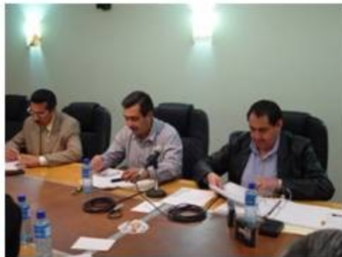
Desarrollo Rural 2 reuniones