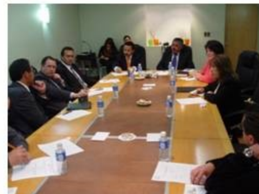
Desarrollo Educación, Cultura y Deporte 2 reuniones