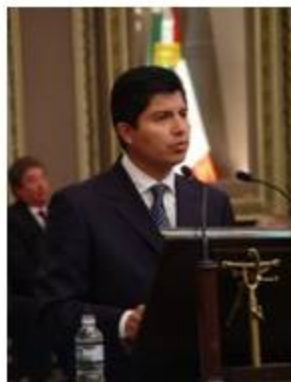
Dip. Eduardo Rivera Pérez, Partido Acción Nacional

“Es tiempo de la política, del diálogo constructivo, de sumarnos todos en un esfuerzo por generar las condiciones que nos permitan reflexionar y debatir los temas de interés ciudadano para lograr los consensos que hagan posible brindar soluciones y orientar el rumbo de nuestra entidad”.