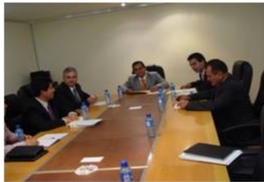
Instructora 1 reunión