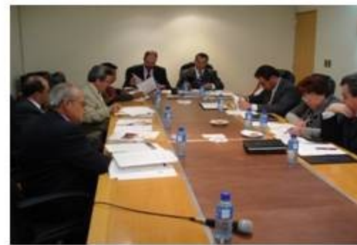
Transparencia y Acceso a la Información Pública 1 reunión