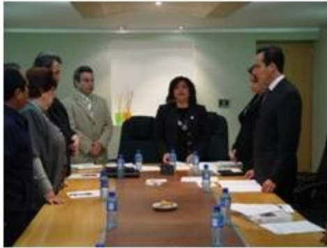
Administración del Patrimonio y de los Recursos Materiales, Técnicos y Humanos 5 reuniones