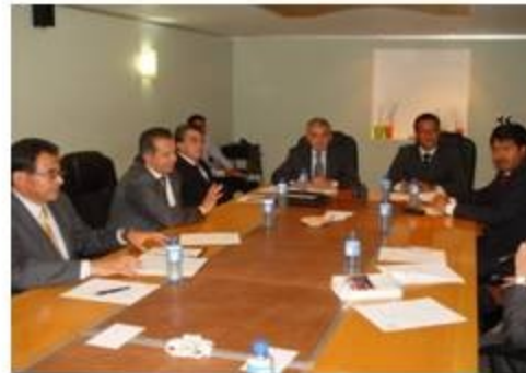
Informática 2 reuniones