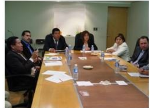
Gestión y Quejas 1 reunión