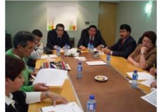
Comunicaciones y Transportes 3 reuniones