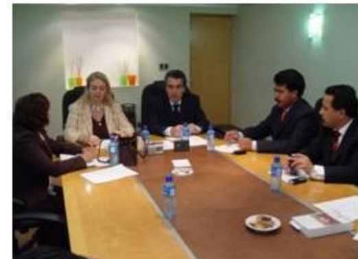
Trabajo, Competitividad y Previsión Social 2 reuniones