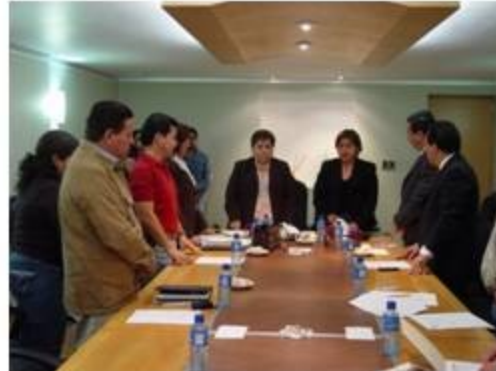
Desarrollo Social 2 reuniones