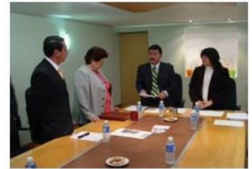
Comunicación Social 2 reuniones