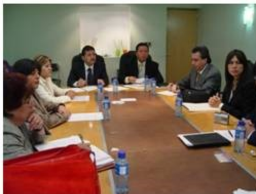
Salud y Grupos con Capacidad Diferenciada 2 reuniones