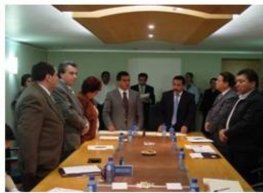
Seguridad Pública y Protección Civil 2 reuniones