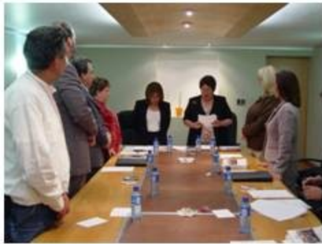
Derechos Humanos 3 reuniones