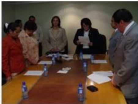
Asuntos Editoriales y Crónica Parlamentaria 2 reuniones