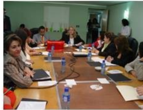
Equidad y Género 1 reunión