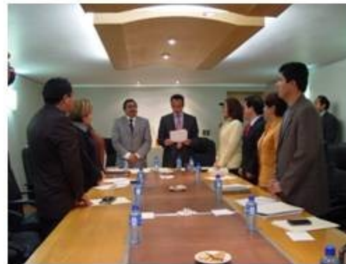
Gobernación, Justicia y Puntos Constitucionales 7 reuniones