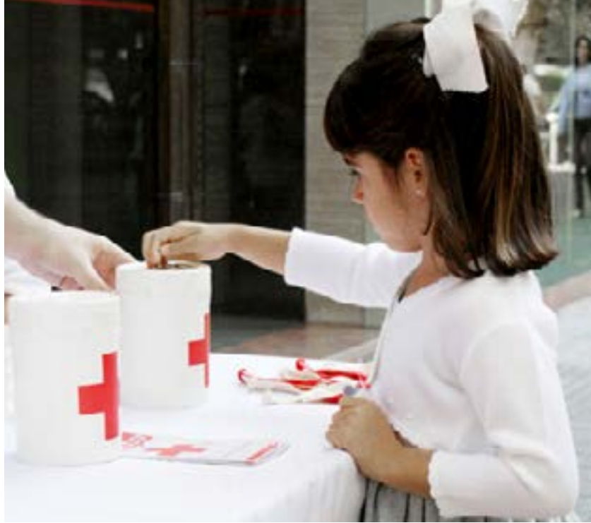
Asistencia al arranque de la campaña de la Cruz Roja