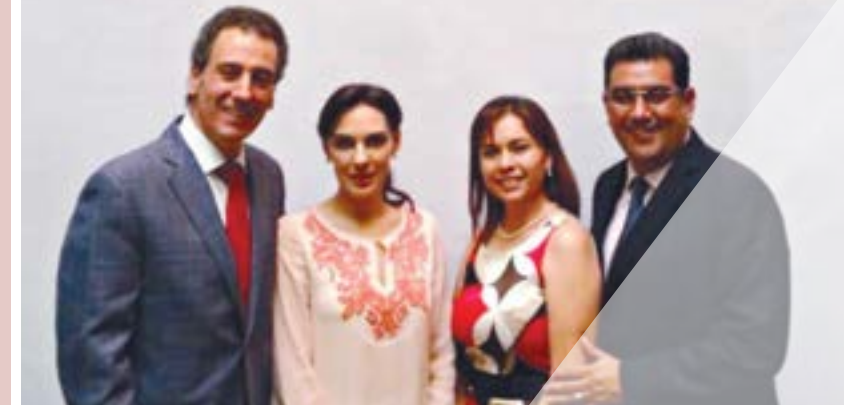
Entrega de Donativo a la Colecta 2014 Cruz Roja Mexicana