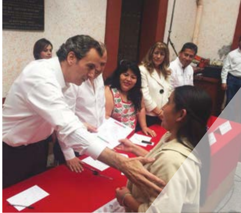
Acompañamiento al delegado de SEDATU para la entrega de Viviendas Dignas