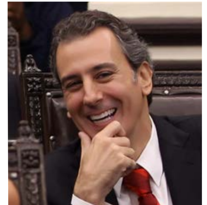
José Chedraui Budib Diputado

Con base en lo dicho y convencido de dar cumplimiento a una obligación con los ciudadanos de Puebla, someto a su amable consideración mi primer informe de labores como diputado integrante de la LIX Legislatura del H. Congreso del Estado de Puebla, que comprende el periodo transcurrido de enero a diciembre 2014.