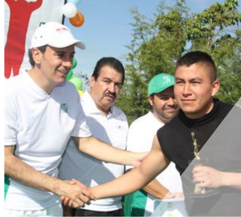
Premiación de la Carrera Corriendo por mi Salud (IMSS-CROC)