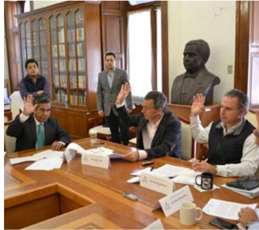
Como integrante de la Comisión de Salud he tenido la oportunidad de gestionar y asistir a diversas reuniones de trabajo como parte de mi actividad de apoyo a los poblanos: