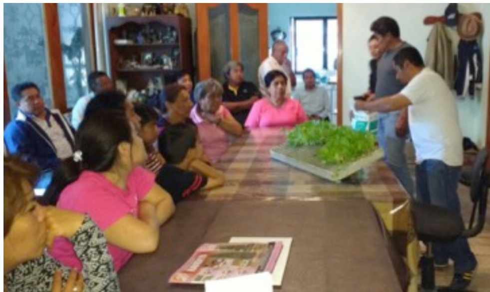
Cursos de Cultivo de Traspatio que fueron impartidos a vecinos de la San Jerónimo Caleras y San Pablo Xochimehuacán.