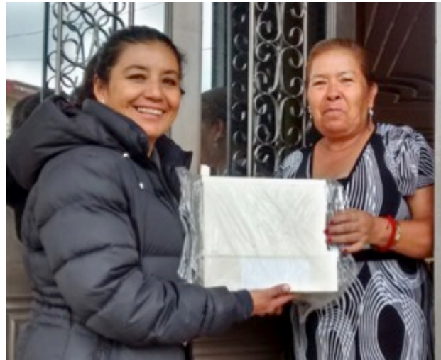
Entrega de alarmas vecinales para colonos de San Sebastián de Aparicio