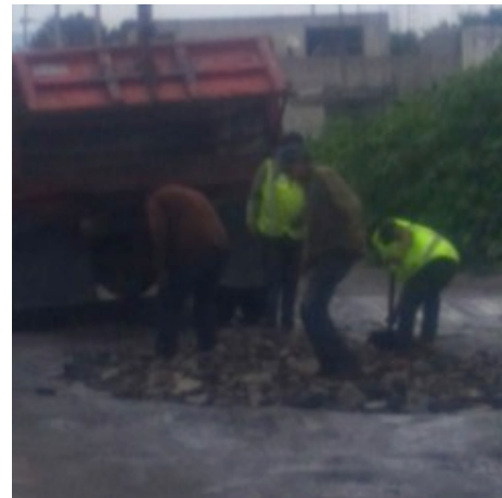
Jornada de Bacheo en el Fraccionamiento la Barranca de La Resurrección