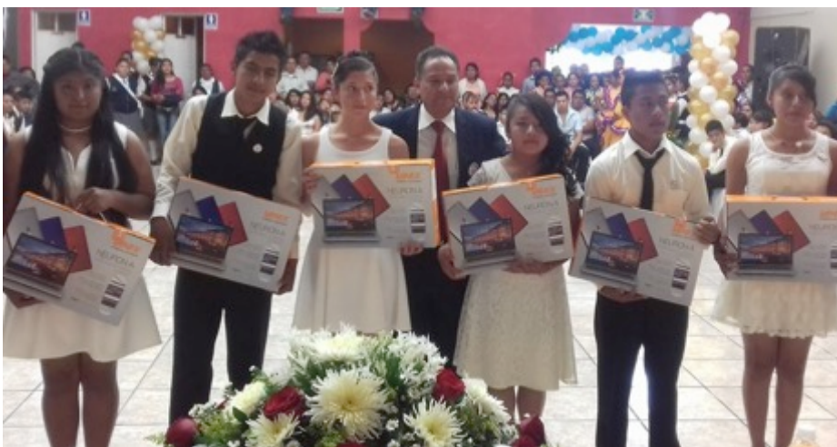
Entrega de computadoras a los mejores promedios del Distrito