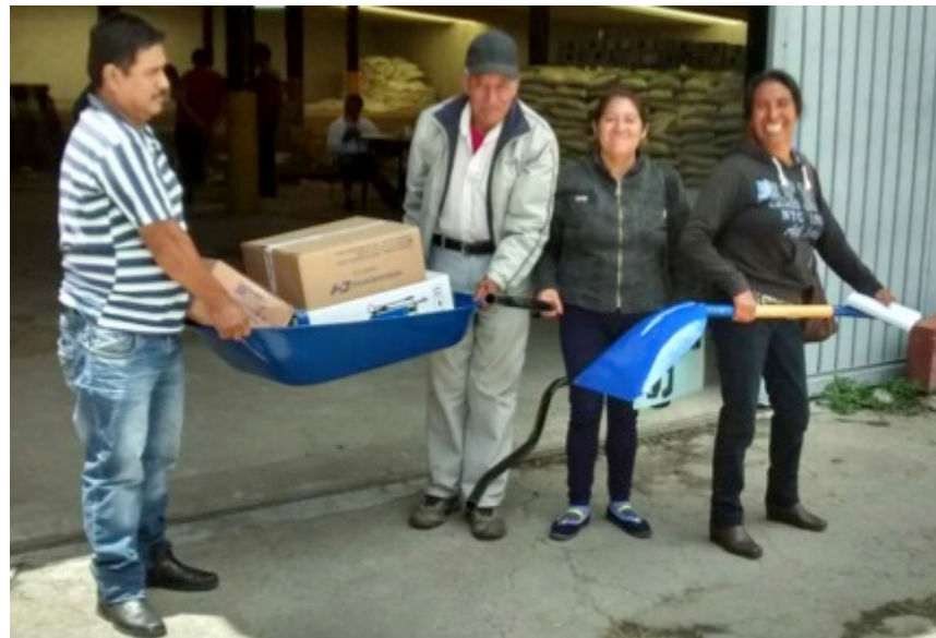
Entrega de Kits de Herramientas para el campo a vecinos de San Miguel Canoa