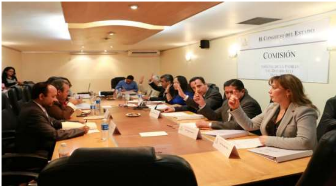
Vocal del Comité de Innovación y Tecnología