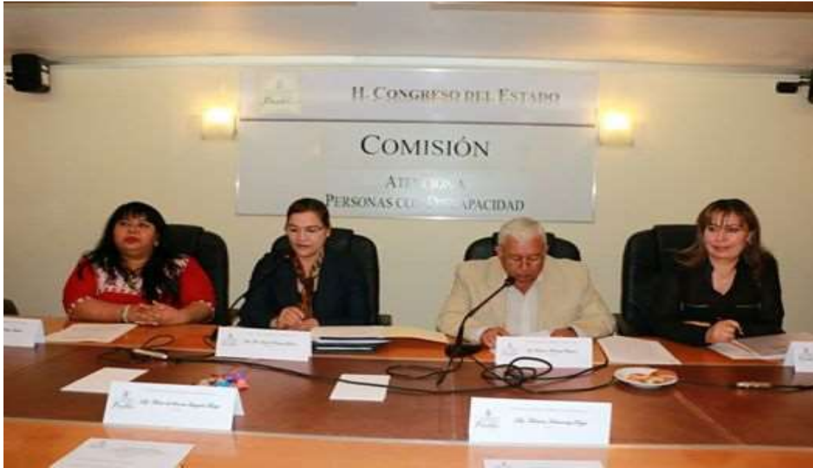
Vocal de la Comisión Especial de la Familia y su Desarrollo Integral