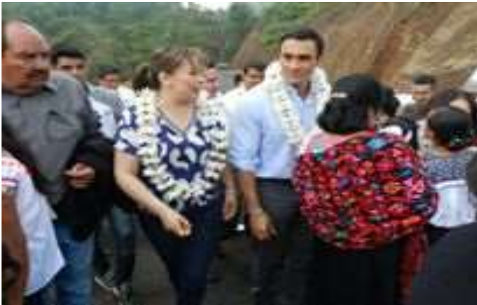
-Inauguración de un techumbre en la Escuela primaria Adolfo López Mateos del Barrio de Taxcala, Teziutlán.