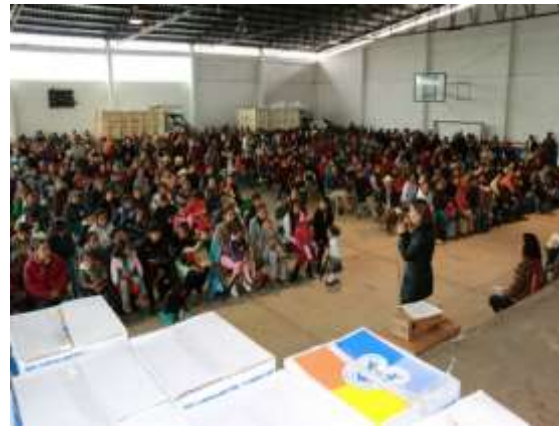
-Entrega de equipo de cómputo en Municipio de Xiuetelco.