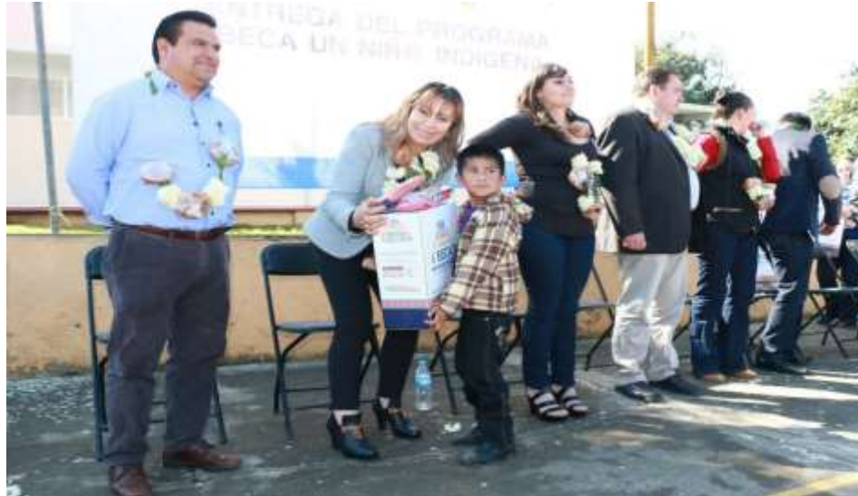
-Entrega de programas alimentarios en Hueytamalco.