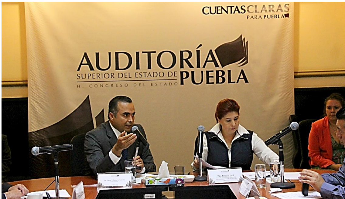
Sesión de 24 de marzo 2015