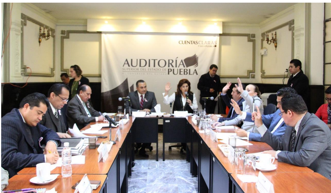
Sesión de 19 de octubre 2015