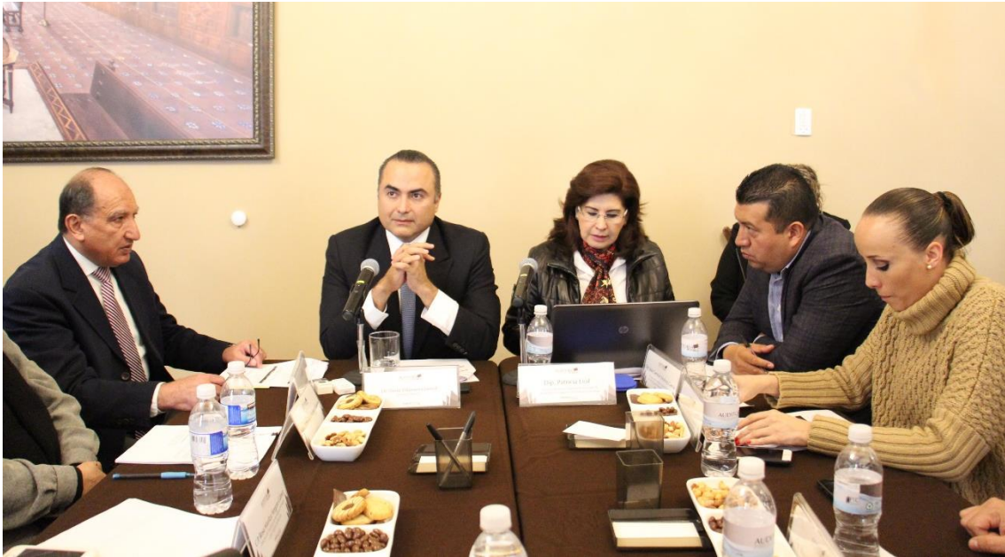
Durante sesión de 10 de diciembre 2015