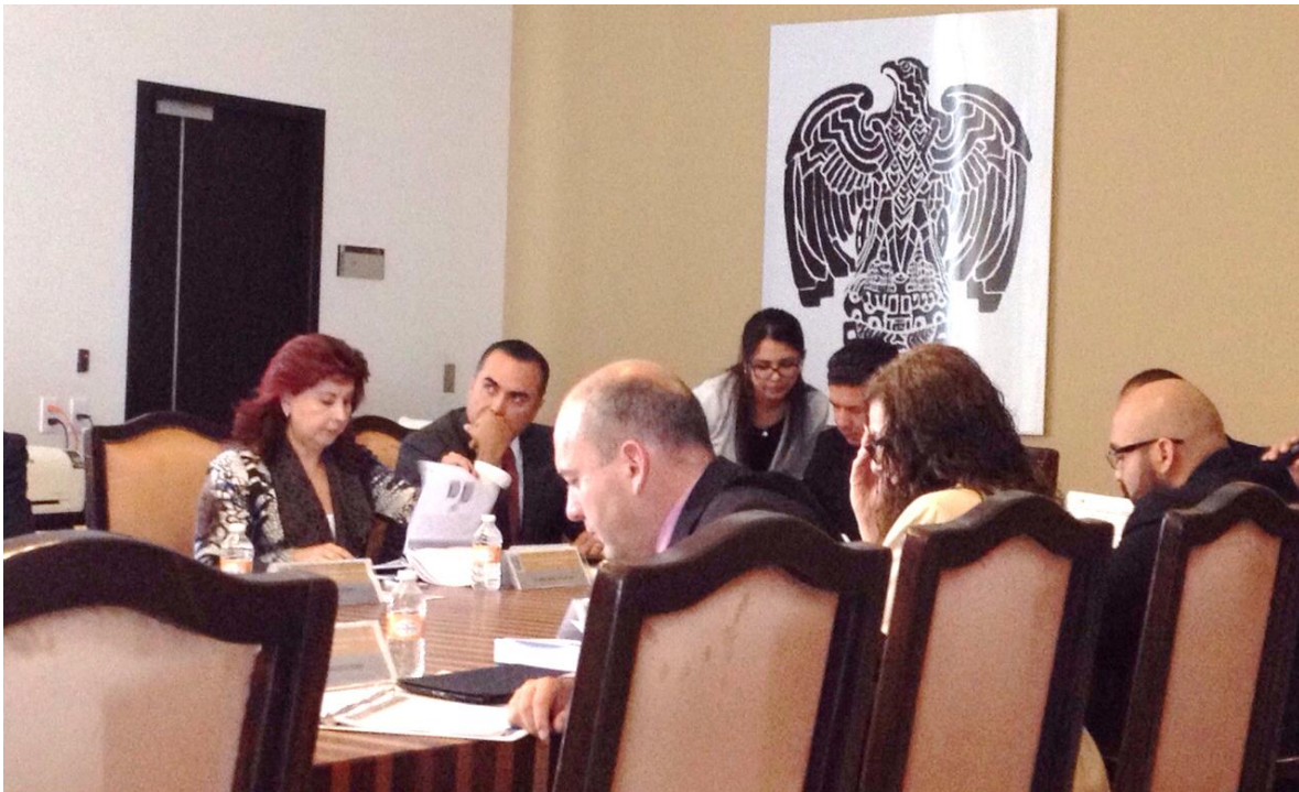
Durante sesión de CACEP de marzo 2015

Dicho punto de acuerdo fue aprobado en pleno en Sesión Extraordinaria el 25 de marzo de 2015 con dispensa de trámite.