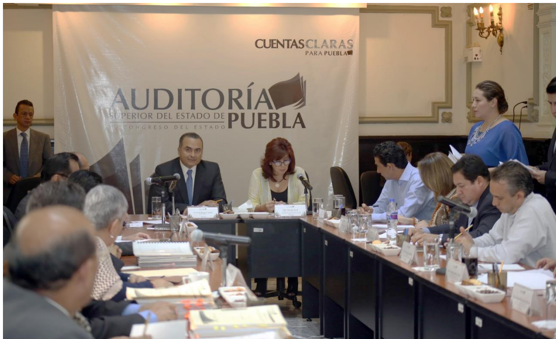
Sesión de 29 de junio 2015