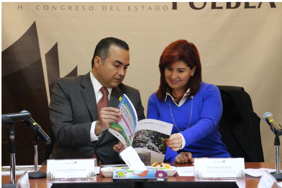
Durante la sesión de 03 de febrero de 2015

La Auditoría Superior del Estado como parte de la labor que realiza para reforzar la cultura de la rendición de cuentas en nuestra sociedad, publica la Revista Cuentas Claras; durante el mes de febrero del año que se informa, la Auditoría Superior publicó el número 3 de la revista, en la que se incluyó en la página 65 el artículo que los integrantes de la Comisión Inspectora elaboramos con motivo de los 190 años de la Fiscalización en México.