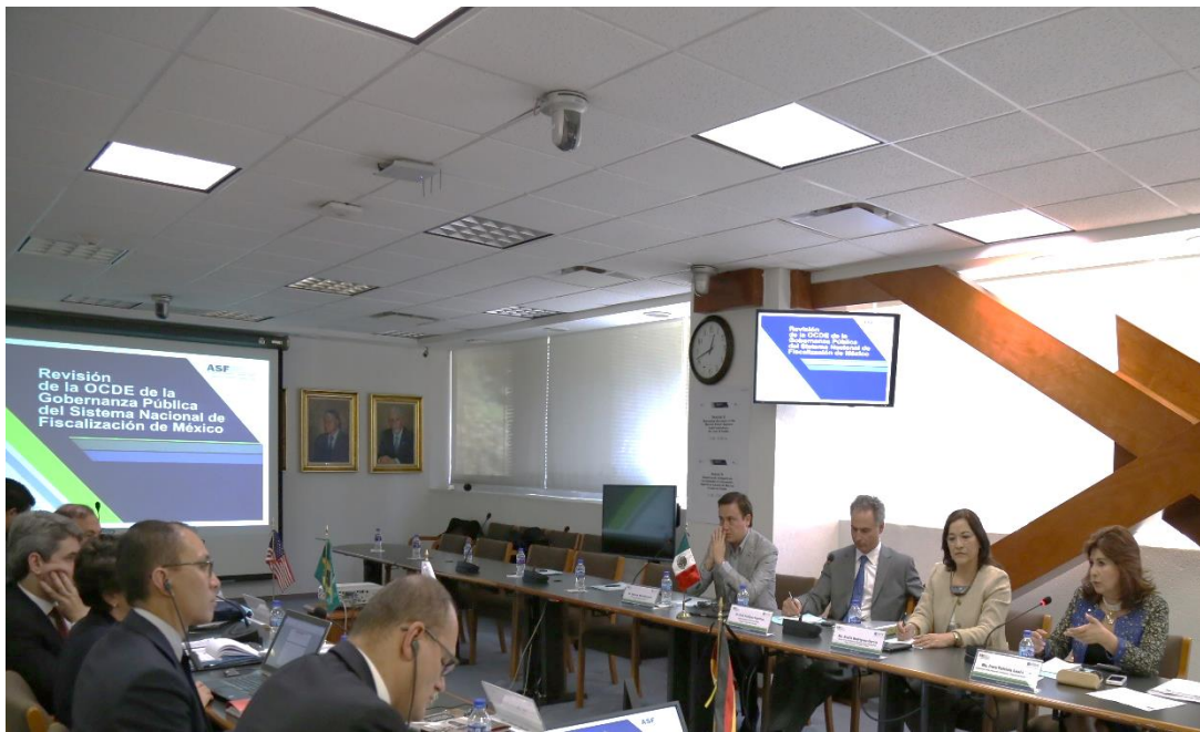
Reunión de trabajo en la Auditoría Superior de la Federación

Razón por la cual, el 7 de octubre del año que se informa, tuvimos el honor de participar en una reunión de trabajo en la que se discutió como la Auditoría Superior del Estado de Puebla podría maximizar aún más su impacto.