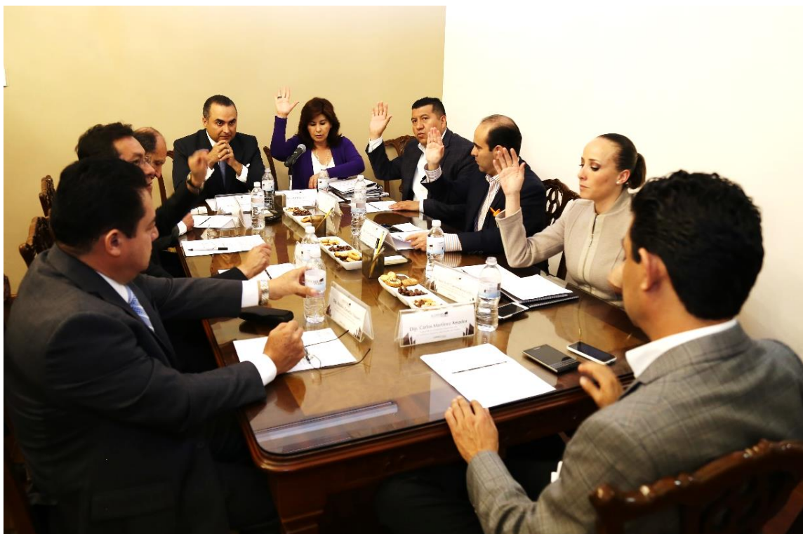
Durante sesión de 10 de noviembre 2015