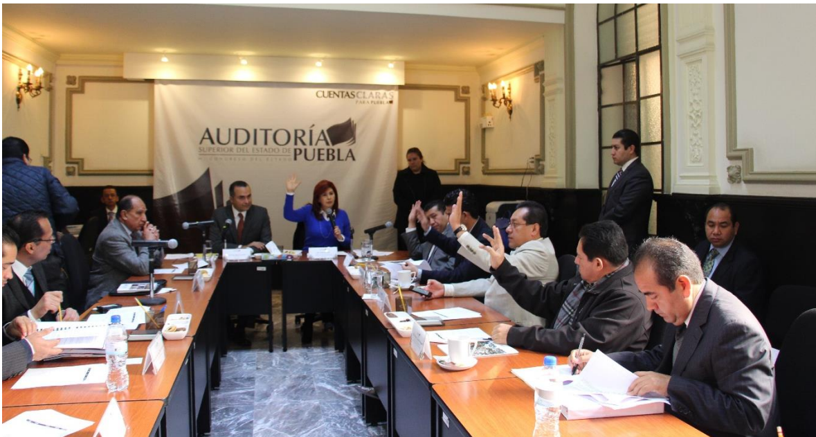
Durante sesión de 03 de febrero 2015

Los integrantes de la comisión Inspectora, con motivo de nuestro trabajo permanente, detectamos una oportunidad de mejora en los ordenamientos que rigen la fiscalización y rendición de cuentas, así como las responsabilidades de servidores públicos, por esa razón, durante el mes de febrero del año que se informa, propusimos una iniciativa de reforma a la Ley de Fiscalización Superior y a la Ley de Responsabilidades de los Servidores Públicos, para regular cómo se debe proceder en caso de fallecimiento de un sujeto de revisión, con el único objetivo de subsanar este aspecto incorporándolo al texto legal.