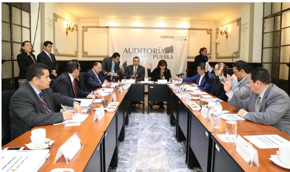
Sesión de 21 de julio 2015