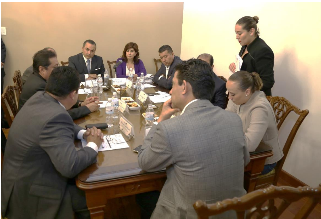
Sesión de 10 de noviembre 2015