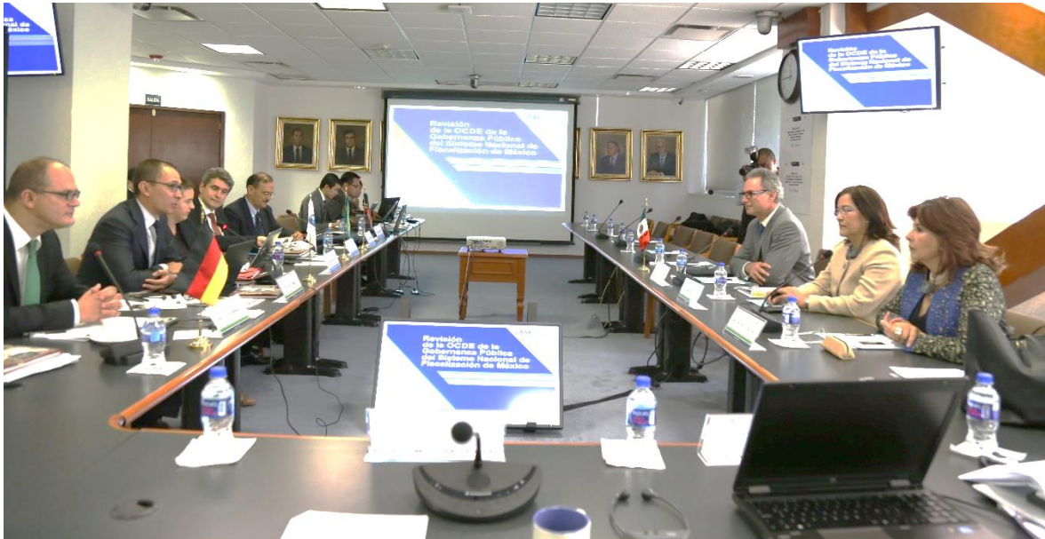
Reunión de trabajo en la Auditoría Superior de la Federación

A partir de 2015 y hasta 2017, la Organización para la Cooperación y Desarrollo Económico (OCDE), llevará a cabo la Revisión a la Gobernanza Pública de la Auditoría Superior de la Federación (ASF) .