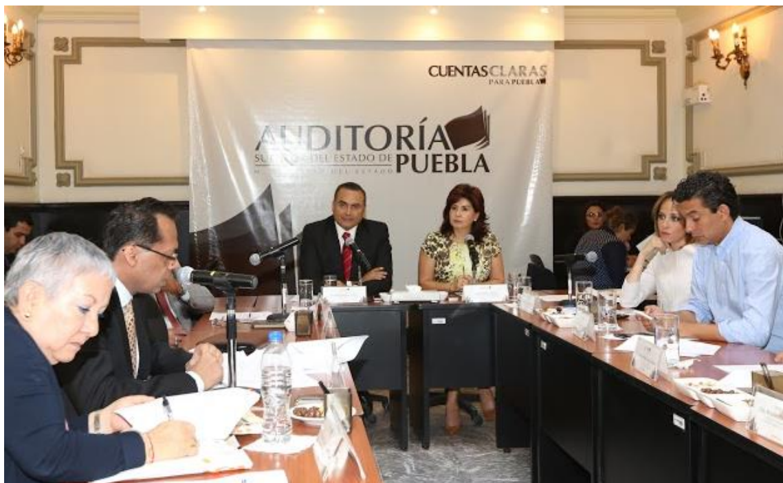
Sesión de 28 de julio 2015