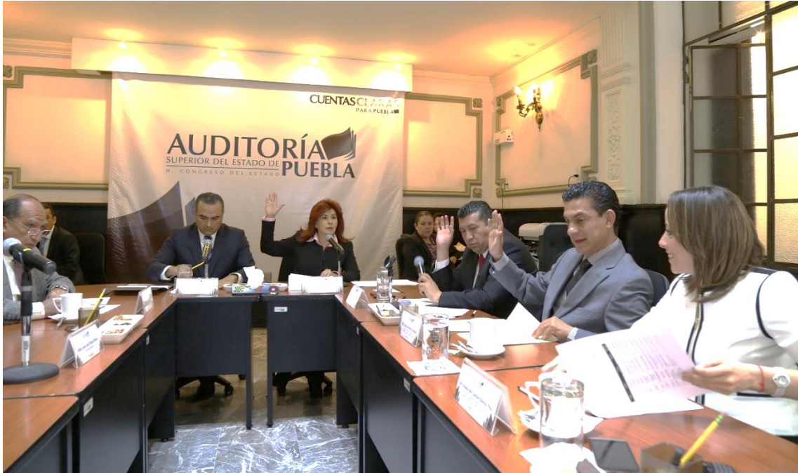
Sesión de 17 de marzo 2015