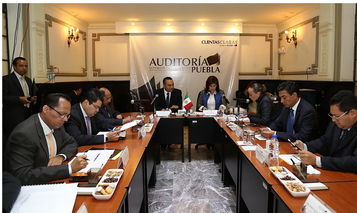
Sesión de 30 de septiembre 2015